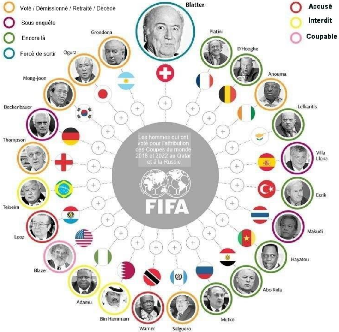
Annexe (1): Les membres de ExCo FIFA présumé de corruption.